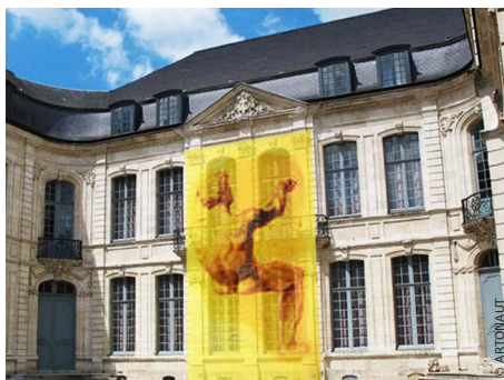
Homère à Saint-Omer, Musée de l'Hôtel Sandelin, France