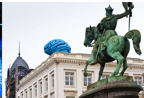
Instrumental, Musée des Instruments de Musique, Bruxelles