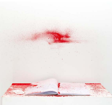
BREATH, Auditoire du Louvre, Paris